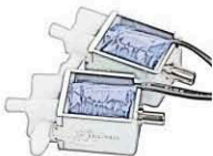
3-way electric solenoid valve