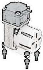
Diaphragm vacuum pump